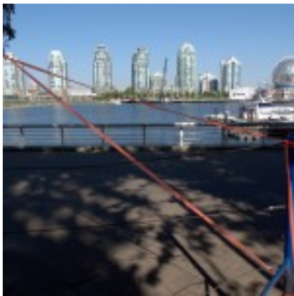
Plaza of Nations, Vancouver 49° 16' 30" N 123° 06' 31" W

All of the photos were taken in the proximity of the 49 th parallel—49°N—the border between Canada and the USA. This line of latitude also runs through a few kilometres of Waldviertel, Austria, where it crosses the 15°E meridian. This turns place into time at a site so close to the Czech border that for almost fifty years it was effectively off limits.